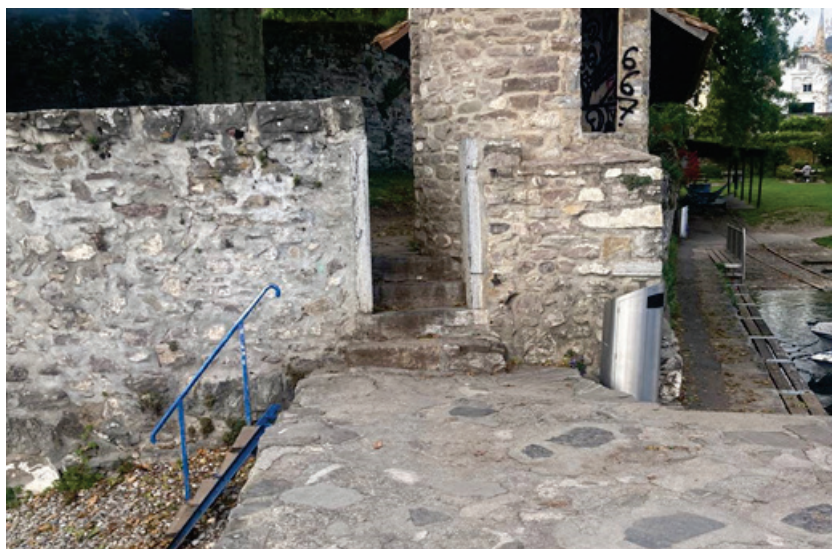
Bain des Hommes – configuration des accès au début de la digue du Château et à la première grève (à gauche de la photo)

L'accès aux deux grèves du bain des Hommes, sis sur le côté externe de la digue de Château, ne peut se faire que via plusieurs marches. Il n'est là non plus pas envisageable de modifier la configuration des lieux pour permettre un accès aux personnes à mobilité réduite. De telles interventions seraient très conséquentes et impliqueraient la création de diverses rampes (inclinaison maximale de 6 % selon les normes en vigueur 1 ) dont on voit mal comment elles pourraient être configurées.