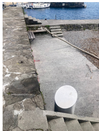
Bain des Hommes – configuration des accès existants à la grève à l'extrémité de la digue du Château

La plage du bain des Dames présente une différence de niveau non-négligeable avec le chemin d'accès y menant. La création d'une rampe d'accès permettant de s'affranchir de ces marches est difficilement envisageable. La longueur de celle-ci serait conséquente et impliquerait le bétonnage d'une zone substantielle de l'actuelle grève de galets. Par ailleurs, même si le bain des Dames est ensuite constituée d'un large secteur où la profondeur est faible, la pente sous-lacustre devient rapidement abrupte et il faudrait à nouveau créer une rampe ou un aménagement conséquent pour permettre la mise à l'eau complète du dispositif proposé.