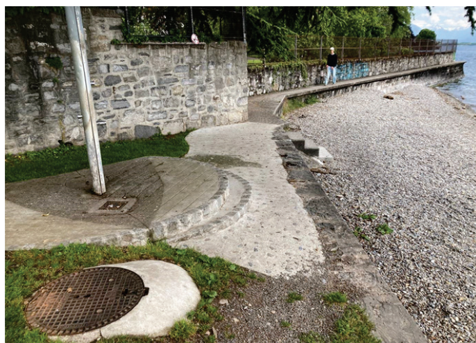
Plage de la Maladaire – configuration actuelle des accès à la grève