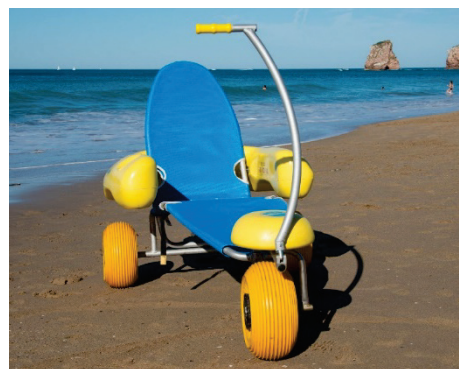
Exemple de chaise flottante de type « Tiralo »

D'ouest en est, les rives communales accessibles au public sont de typologie variées. Chaque site d'accueil potentiel a été analysé en détail et le résultat de cette réflexion est présenté ci-après. Outre l'infrastructure d'accès à l'eau en elle-même (rampe en pente douce, notamment), il est à noter qu'il faudrait également prévoir un lieu permettant le passage d'une chaise « terrestre » à la chaise « aquatique » et un endroit adapté permettant de se changer.