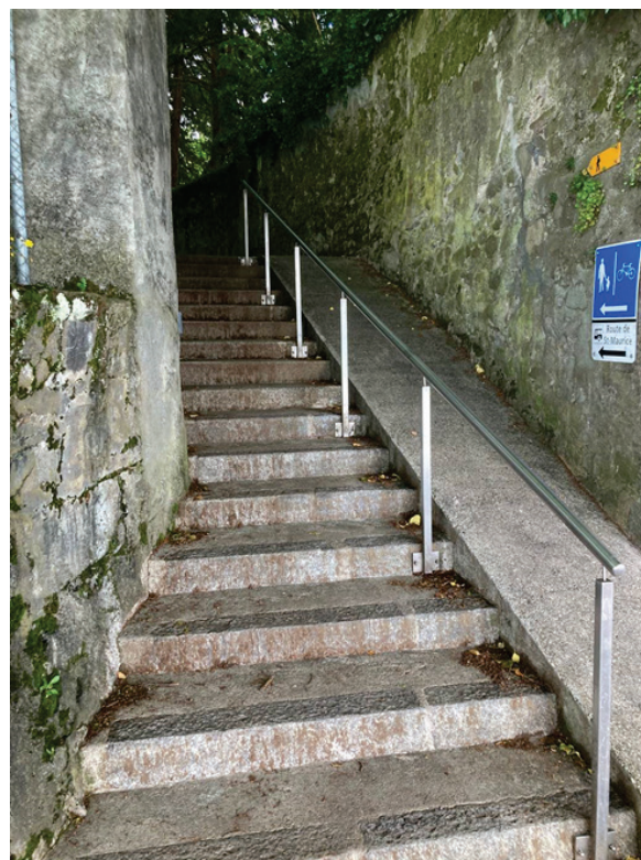
Bains de la Becque – accès depuis la route de St-Maurice