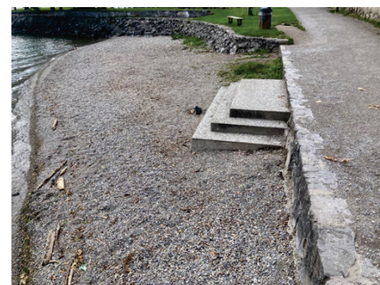
Bain des Dames – accès existant

La plage du bain des Dames présente une différence de niveau non-négligeable avec le chemin d'accès y menant. La création d'une rampe d'accès permettant de s'affranchir de ces marches est difficilement envisageable. La longueur de celle-ci serait conséquente et impliquerait le bétonnage d'une zone substantielle de l'actuelle grève de galets. Par ailleurs, même si le bain des Dames est ensuite constituée d'un large secteur où la profondeur est faible, la pente sous-lacustre devient rapidement abrupte et il faudrait à nouveau créer une rampe ou un aménagement conséquent pour permettre la mise à l'eau complète du dispositif proposé.