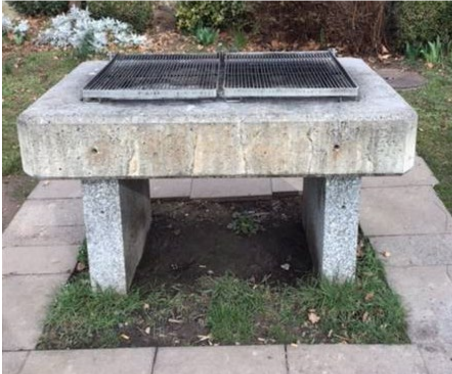
Grill existant dans le jardin du Château

Au terme de la saison estivale 2022, une évaluation des mesures mises en œuvre et leur efficacité sera réalisée afin de valider le concept et/ou de l'adapter.