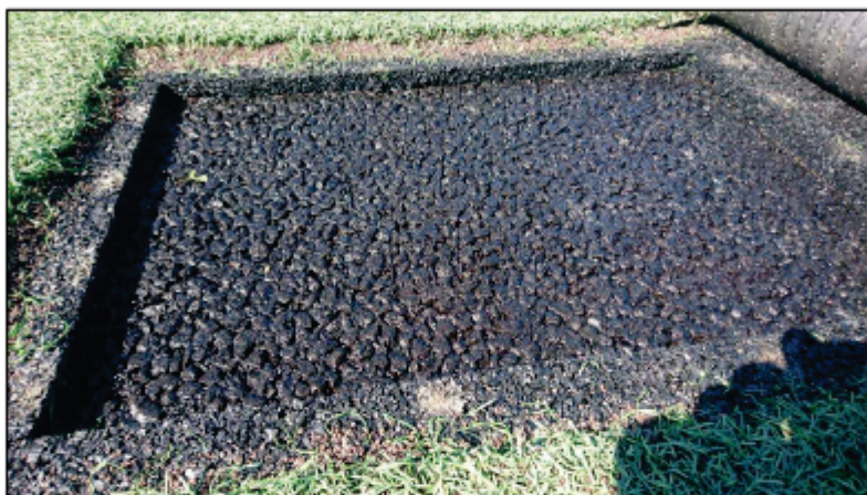
Vue en coupe sur le système sous-couche coulée/tapis synthétique

La sous-couche a été coulée sur une infrastructure en enrobés drainants.