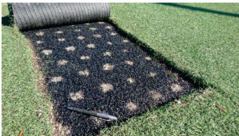
Aspect de surface

Tous les sondages présentent le même aspect, la couche de souplesse est réalisée avec un granulat de caoutchouc grossier et un liant monocomposant.