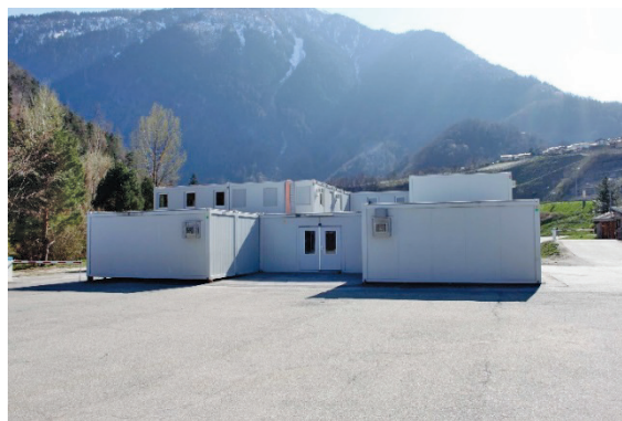
Vue de l'entrée du pavillon pour l'UAPE

Les plans complets des deux bâtiments sont annexés au présent préavis.