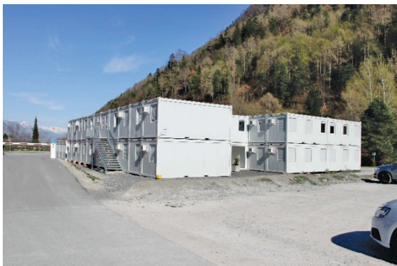
Photo des pavillons des classes