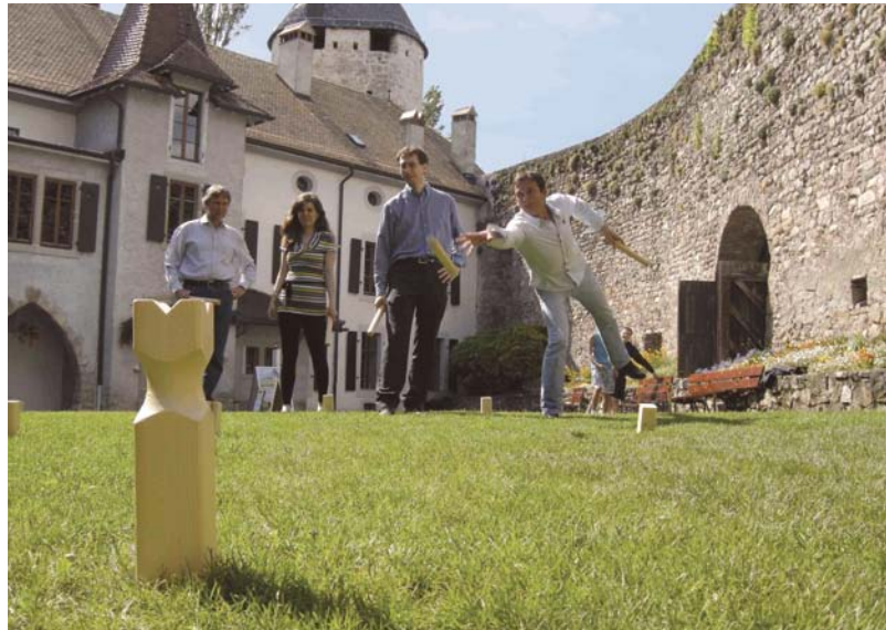
Jeu de plein air d'origine viking, le Kubb est une combinaison du jeu de quilles, du lancer de fer-à-cheval et des Echecs. Le mot «Kubb» signifie «bloc de bois» en dialecte du Gotland (île suédoise de la Baltique). A découvrir le 28 juin !

Pour compléter cet échantillon d'activités, il convient aussi de noter que l'équipe du Musée proposera des ateliers, des conférences et des visites guidées de l'exposition permanente ainsi que divers jeux de plein air propres à la belle