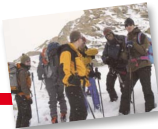
Le Club montagnard : un siècle de découverte et de convivialité.