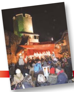
Magie et esprit de Noël régneront dans la cour du Château samedi 19 décembre.