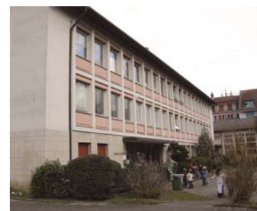
La rénovation du Collège Courbet figure au plan des investissements.

De manière générale, la Municipalité a tenu, dans l'établissement de son budget 2010, à valoriser les excédents de recettes des années précédentes par le biais de l'investissement. De surcroît, elle souligne que ce budget n'est que marginalement touché par les effets de la crise économique et financière qui a débuté en 2008. ■