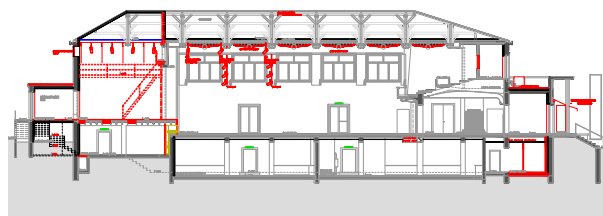
Plan en coupe de la salle rénovée. ■