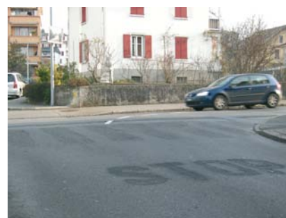
Suite à l'introduction des zones 30, certaines lignes jaunes ont disparu, à l'exemple de la rue du Collège.

La Municipalité et Police Riviera poursuivent leur action dans ce domaine. De l'aménagement du mobilier urbain (chicanes, bacs, signalisation au sol...) à la prévention, en passant par la répression (radars), tout est mis en œuvre afin que la sécurité dans ces zones devienne optimale, étant entendu que, malheureusement, le risque zéro n'existe pas. ▮