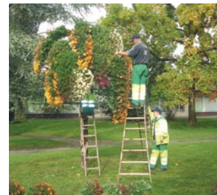
Automne 2007, festival de couleurs...

En prévision de ce reportage sur les jardiniers de la commune, notre photographe avait soigneusement consigné sur pellicule la confection de l'arbre décoratif du collège Courbet. Aux géraniums de l'été succédaient alors les chrysanthèmes colorés d'automne. Succès assuré, comme toujours. Mais voilà, les vents d'hiver peuvent parfois être dévastateurs... Une chose est certaine, nos jardiniers, eux, ne se laissent pas abattre et nous préparent déjà une nouvelle installation florale prête à connaître