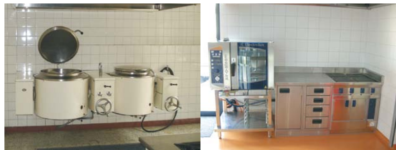
Changement d'étage et de génération pour la cuisine.