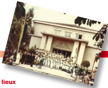
La proclamation de la Fête des vignerons 1955, une des très nombreuses manifestations que la salle a abritées.