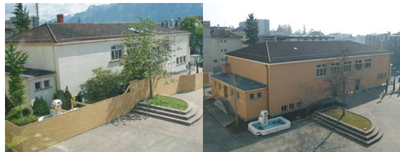
Retour à la couleur originale de 1938.