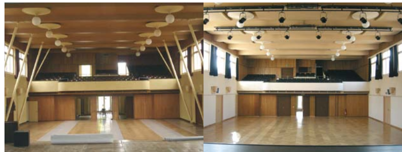
Un volume retrouvé grâce à la disparition des béquilles et à un parquet neuf.

Il va enfin de soi que l'isolation, les sanitaires, la peinture et l'électricité ont été intégralement refaits. ■