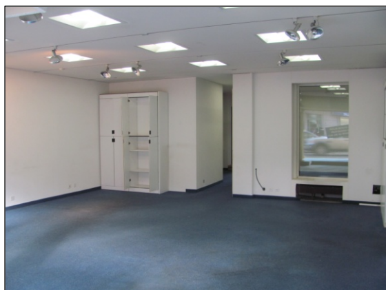
Vue intérieure depuis entrée Grand-Rue