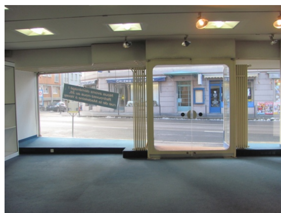
Vue vitrines sur la Grand-Rue