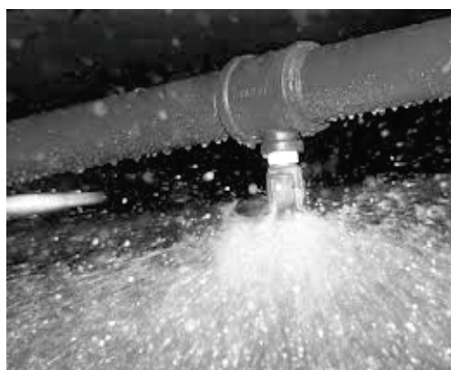
Une buse "Sprinkler" en fonction.

Une installation "Sprinkler" se présente sous la forme d'un réseau de tuyauteries installées en partie haute des locaux à protéger. Elle est équipée de têtes spéciales appelées communément "Sprinkler". Ces têtes ont un dispositif thermosensible qui s'ouvre à une certaine température et débite de l'eau sur le secteur d'incendie. Ce réseau est alimenté en permanence en eau sous pression passant à travers un poste d'alarme.