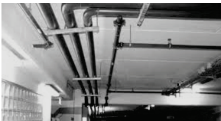
Vue d'une installation en plafond.