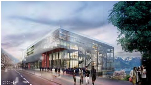
© Montreux - Projet lauréat du MEP

Les syndicats ont été informés de l'avancement du projet de rénovation de l'important équipement régional qu'est le 2m2c et du dépôt d'un préavis au Conseil communal de Montreux portant sur le crédit d'étude de l'avant-projet. Celui-ci ayant été accepté, la CSD sera à nouveau saisie de cet objet dès cet automne.