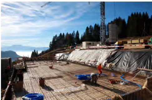
© Blonay - Chantier de l'Espace régional des Pléiades

Le préavis CIEHL a été adopté par les dix Conseils communaux de la Riviera au printemps 2016. Les conditions relatives au financement global du projet ayant été réunies, le chantier de construction a démarré en octobre 2016. La CSD a été informée de l'avancement des travaux. La mise en service est prévue pour l'hiver 2017-2018.