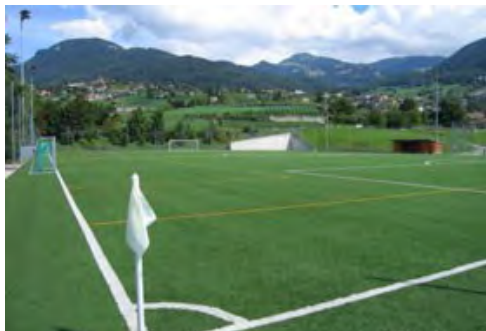
© Montreux - Saussaz : terrains de football

Il est rappelé que les terrains de football et le stade régional d'athlétisme ont chacun fait l'objet d'un préavis régional adopté par les dix Conseils communaux de la Riviera, permettant ainsi le financement de ces infrastructures sportives d'importance régionale. Ces projets ont fait l'objet d'un suivi dans le cadre de la CSD.