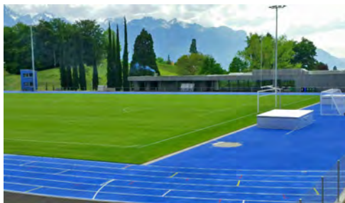
© Montreux - Saussaz : stade régional d'athlétisme

L'année 2016 a été marquée par l'inauguration du stade régional d'athlétisme de la Saussaz en mai (Saussaz Est), puis par l'inauguration des terrains de football en septembre (Saussaz Ouest), finalisant ainsi l'ensemble du complexe sportif de la Saussaz.