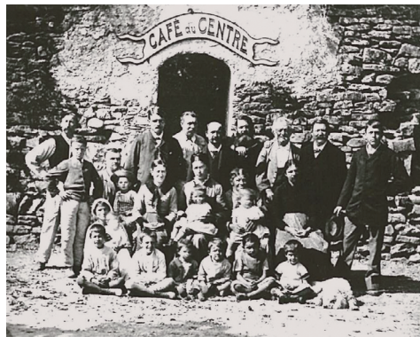
Courbet (au centre, en haut) et ses amis devant le Café du Centre. Archives communales.

en valeur à travers une signalétique et une stratégie de communication dans la perspective du bicentenaire de la naissance de l'artiste en 2019.■